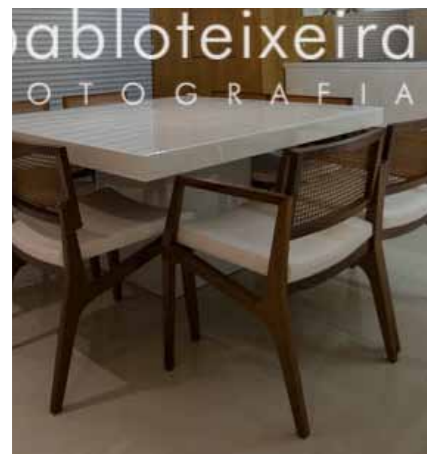
Sierra Móveis Rua Blumenau, 873 Fone: (47) 3455 4419