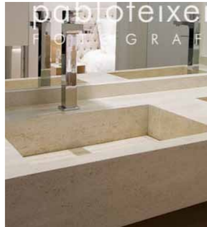
Pedras Kraisch Rua Blumenau, 2020 Fone: (47) 3435 4755