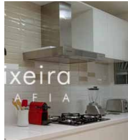
Ofício & Design Rua Blumenau, 1.200 Fone : (47) 3433 8325