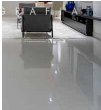
Portobello Shop Rua Araranguá, 116 Fone: (47) 3433 4006