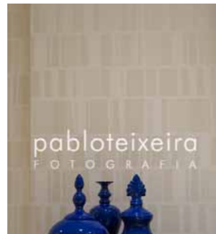
Cantos & Encantos Rua Rolf Colin, 109, Salas 06 e 07 Fone: (47) 3433 7558