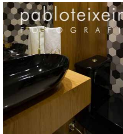
Di Fatto Interiores Rua Visconde de Taunay, 1.174 Fone: (47) 3439 0970