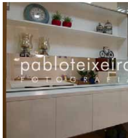
Primus Interiores Rua Pascoal Fillipi, 426 Fone : (47) 3473 6341